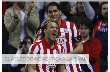
EL ATLÉTICO SE ACERCA A LA FINAL