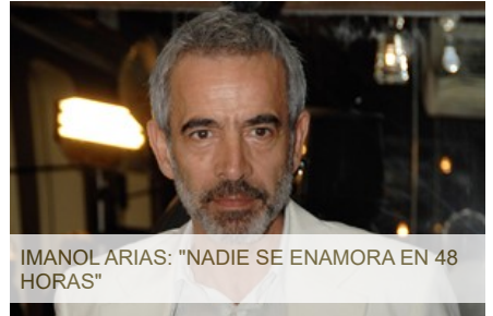
IMANOL ARIAS: "NADIE SE ENAMORA EN 48 HORAS"